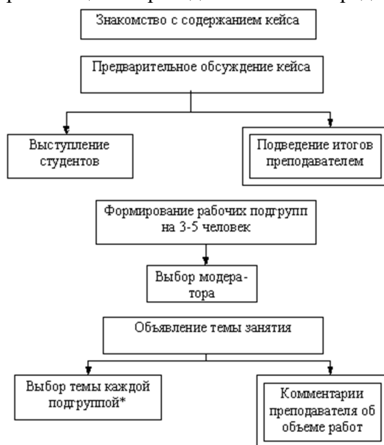
Стадия организации работы над кейсом

Последовательность организации и проведения занятий представлена на рисунках.